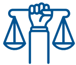
Enfoque de Derechos Humanos