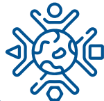
Enfoque de género y diversidad