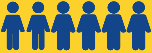
Asistentes inscritos en listas de asistencia por mesa*